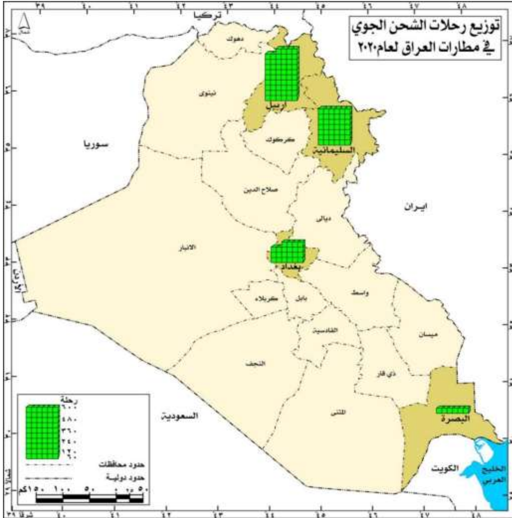
خريطة (٢) توزيع رحلات الشحن الجوي في مطارات العراق لعام ٢٠٢٠

بالاعتماد على: جمهورية العراق، مجلس الوزراء، سلطة الطيران المدني، شعبة تخطيط واقتصاديات النقل الجوي، التقرير الاحصائي الشامل للنقل الجوي لعام ٢٠٢٠، الاصدار الاول، آذار ٢٠٢٠، ص ٢٧.